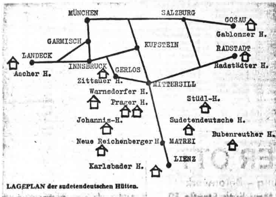
LAGEPLAN der sudetendeutschen Hütten.