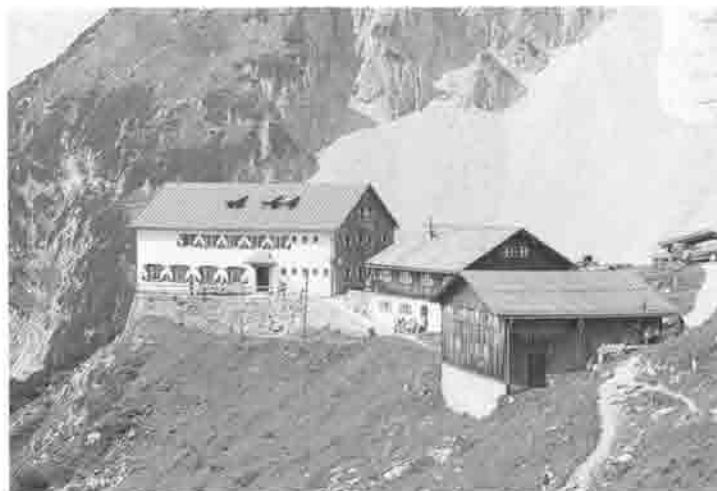
Die Gruttenhütte im September 1999.