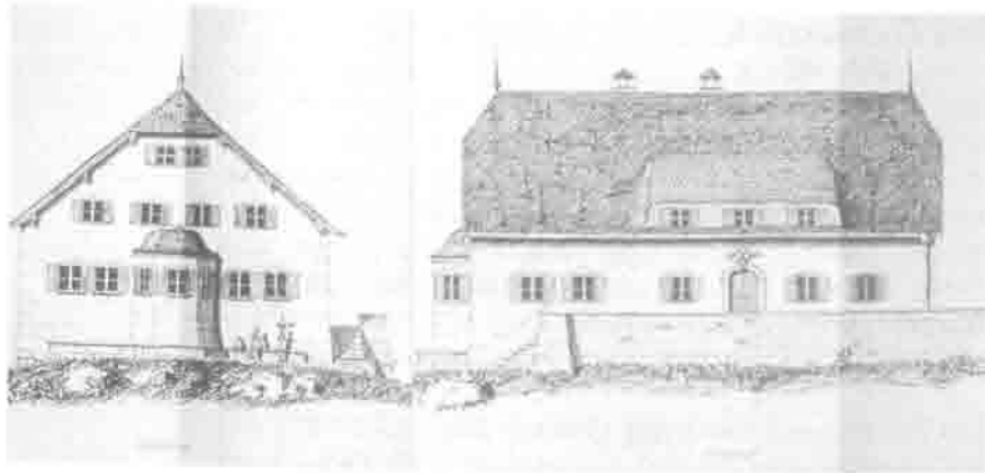
Gruttenhütte, nicht ausgeführte Ausbauplanung 1941.