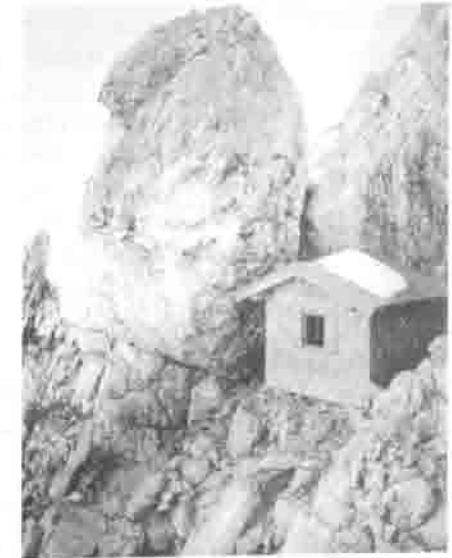
Zweite Babenstuber-Hütte auf der Ellmauer Halt, 2344 m, von 1970 (links); dritte (neue) Babenstuber-Hütte, 2300 m, von 1983 (rechts).

desolat. Nach mehrmaliger Renovierung und verschiedenen Blitzeinschlägen ist eine Reparatur nicht mehr möglich, ein Neubau an einer anderen Stelle wird geplant. Die österreichische Bergrettung Scheffau findet im Frühsommer 1983 einen guten Standplatz (auf etwa 2300 m, also 40 m unter dem Gipfel in westlicher Richtung oberhalb der „Maximilianstraße“) und bereitet das Fundament für den Bau vor. Die Hütte wird in der Zimmerei Koller in Söll vorgefertigt und aufgebaut, dann in Einzelteile zerlegt und auf die Gruttenhütte transportiert. Am 16.8.1983 wird von den Männern der Bergrettung die alte Gipfelhütte abgebrannt, der Platz eingeebnet und vom Unrat vieler Jahrzehnte gesäubert. Das Wetter ist aber zu schlecht, um den Hubschraubertransport der Hüttenteile durchführen zu können.