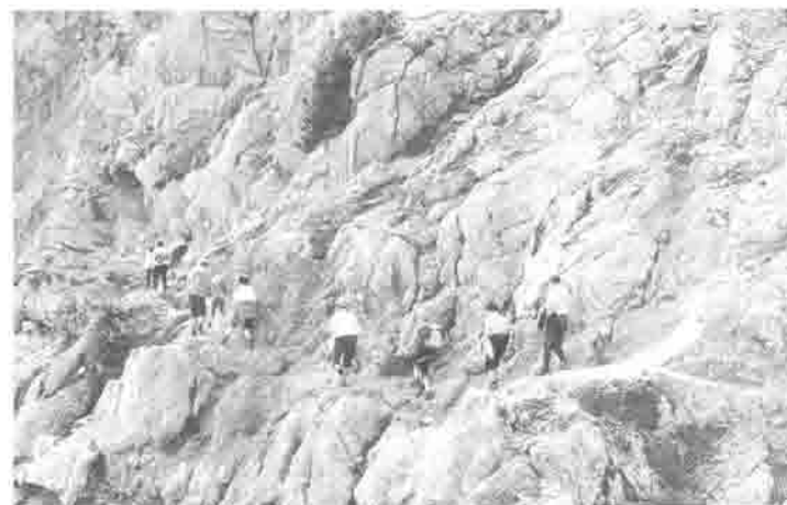
Wandergruppe am Jubiläumssteig (1979).

Auf der Gruttenhütte ist 1925 wieder ein hartes Stück Arbeit der Vollendung entgegengegangen. 25 Jahre sind