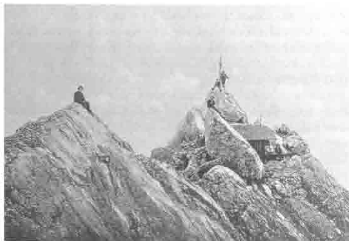
Die Gipfelhütte geht in den Besitz des Turner-Alpen- Kränzchens über.

Halt zur unentgeltlichen Übernahme an. Dieses Angebot wird mit Freuden angenommen, kann man doch damit für den Verein einen kleinen, aber doch bemerkenswerten hochalpinen Stützpunkt in Besitz nehmen. Außer dem oben erwähnten Zuschuss sind dem TAK bis dahin auf dieser Hütte keine Ausgaben entstanden. Im Einverständnis mit der Sektion Kufstein, die dem TAK das fragliche Gebiet abgetreten hat, werden für das Jahr 1897 jedoch größere Aufwendungen für die Instandsetzung der Wege eingeplant.