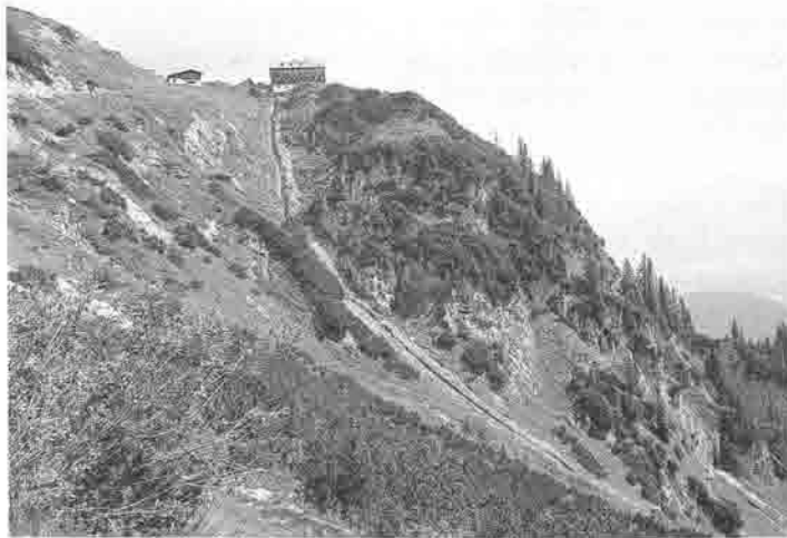
Kanalbau Gruttenhütte, September 1999.

führen die Scheffauer Bergrettung, zusammen mit Ernst Erhart jun. , dem Sohn des Pächterehepaars, durch. Dabei wird auch das Dach der Babenstuber-Hütte verstärkt, bei dem durch den Schneedruck einige Streben gebrochen waren. Material und Stromaggregat werden per Hubschrauber auf den Gipfel geflogen.