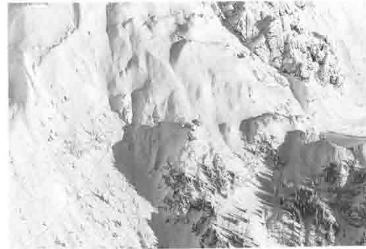
Luftbild der Gruttenhütte (Dez. 1999). Die Rinne über dem Josef-Dorn-Haus zeigt deutlich den Weg des bereits zweimaligen schadenbringenden Lawinenabgangs.

Endlich ist es so weit, im Jahr 1999 wird der Abwasserkanal fertig gestellt. Mit Hochdruck arbeitet man im kurzen, aber diesmal ausgezeichneten „Kaisersommer“ und kann rechtzeitig zum Kirchweihfest am 16./17.10.1999 die Anlage in Betrieb nehmen. Dass dabei schon die erste Panne passiert, weil Feststoffe, die nicht ins