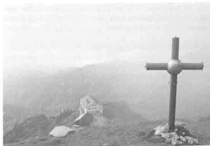
Gipfelkreuz der Ellmauer Halt von 1883–1983 am neuen Standort oberhalb der Gruttenhütte.