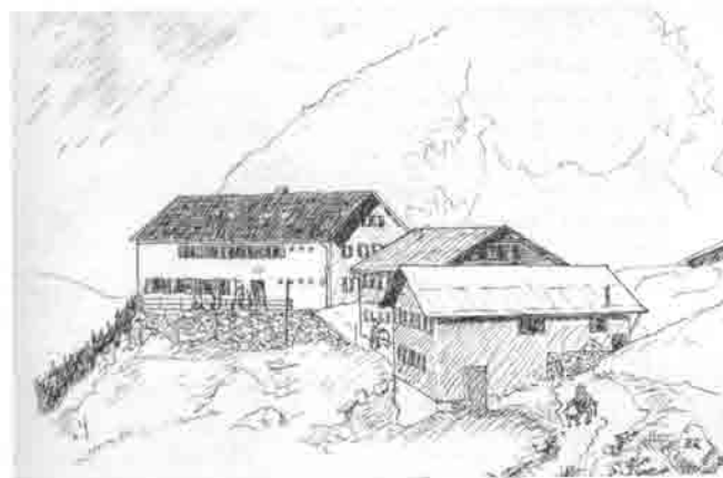
Feier zum 100. Geburtstag auf der Gruttenhütte am Samstag / Sonntag, den 15./16. Juli 2000