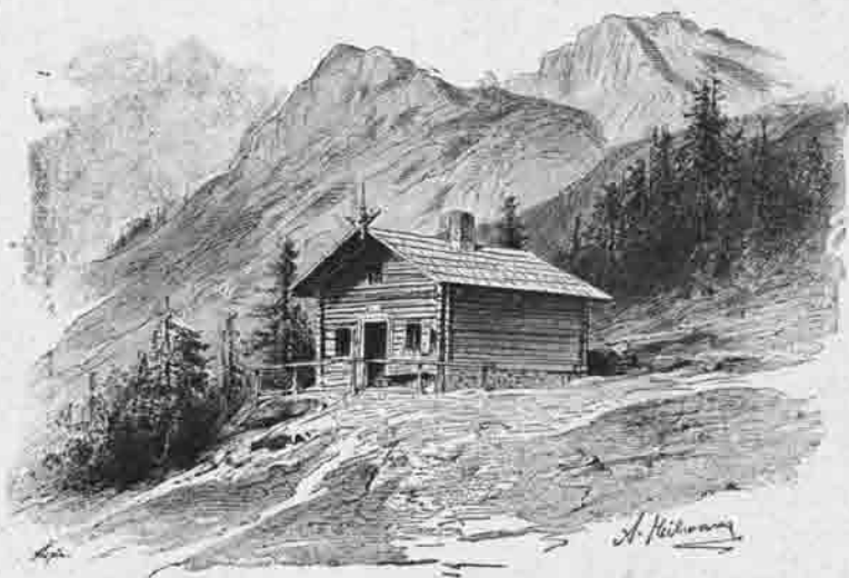
Bertha-Hütte 1620 Meter.

Neben der Thätigkeit für die würdige Durchführung der Festlichkeiten entfaltete die Section auch noch in anderen Richtungen eine erfreuliche Regsamkeit. Der schon in den Vorjahren vorbereitete Bau einer Hütte am Mittagkogel wurde nahezu fertiggestellt, ein Steig auf den Gipfel des Manhart gebaut und gelegentlich der Generalversammlung eröffnet, schliesslich der Fusssteig von Nötsch auf den Dobratsch zum Saumweg verbreitert. Ausserdem beschäftigte sich die Section mit der Regelung des Führerwesens und der Herausgabe eines Tourenverzeichnisses für das Canalthal. Auch in humanitärer Weise hatte die Section im Herbst 1885 wieder Gelegenheit ihr Können zu zeigen. Eine der 1882er Hochfluth in ihren Wirkungen ganz ähnliche trat ein, von der besonders das Gail- und Canalthal arg berührt wurden. Die Section stellte sich rasch an die Spitze der für Oberkärnten eingeleiteten Hilfsaction, und ergaben die durch den Centralausschuss und die Section eingeleiteten Sammlungen ein Ergebnis von fl. 5122·53, welche Summe grösstentheils noch im Herbst 1885, der Rest im folgenden Jahre in 27 Gemeinden Oberkärntens direct durch Sectionsmitglieder an die Nothleidenden zur Vertheilung gelangte. Ein kleiner Rest kam erst in den folgenden Jahren bei anderen Elementarunfällen zur Verwendung. Die im Jahre 1885 erbaute Bertha-Hütte am Mittagkogel wurde am 4. Juli 1886, bei Anwesenheit der Pathin Frau Bertha Moritsch und grosser