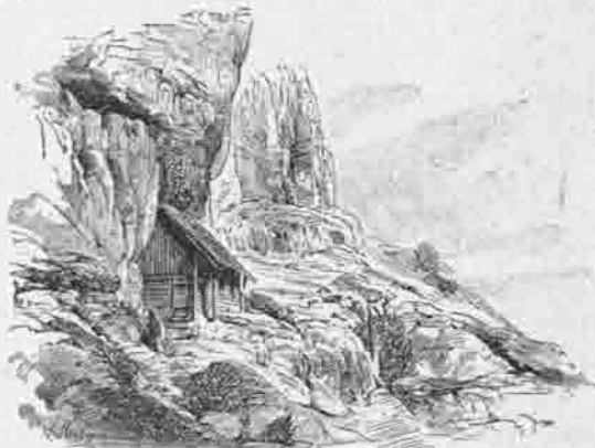
Wischberg-Hütte 1900 Meter.

Die rund 1050 fl. betragenden Baukosten wurden durch die Subvention der Centrale von 700 fl., der Restbetrag aus Sectionsmitteln gedeckt.