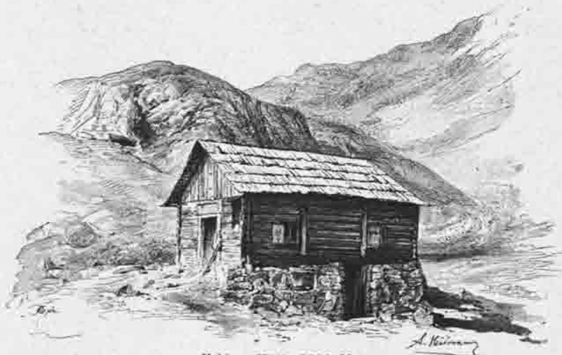
Feldner-Hütte 2200 Meter.