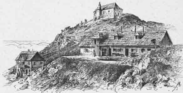
Villacher Alpenhäuser 2130 Meter.

nun ans Werk geschritten, zuerst der Fahrweg 1869—1870 ausgebaut, dann mit Benützung der schon bestehenden gemauerten Unterkunftshütte durch den Zubau einer Küche und eines grösseren hölzernen Gebäudes mit Gastzimmer und Schlafstellen das sog. Bleibergerhaus fertiggestellt. In den folgenden Jahren 1871—1872 konnte dann das Sr. kais. Hoheit, dem Kronprinzen Rudolf zubenannte Rudolfshaus, ein Blockbau mit Schlafsaal und mehreren Zimmern, vollendet werden. Die Alpenhäuser enthielten 40 Betten in separirten Zimmern und im Schlafsaale, ausserdem Schlafstellen für weitere 20 Personen. Diese Bauten waren für die damalige Zeit epochemachend, gab es doch in den Ostalpen noch kein derartiges Alpen-Gasthaus auf einem Gipfel von mehr als 2100 Meter Seehöhe. Die Thatkraft der leitenden Persönlichkeiten, die sämtlich der Section angehörten, verdient die grösste Anerkennung. Im Jahre 1882 ging die Verwaltung der Alpenhäuser auf die Section Villach über. Heute entsprechen die baulichen Verhältnisse allerdings den Anforderungen der Neuzeit nicht mehr ganz, und werden die Alpenhäuser umgebaut werden müssen.