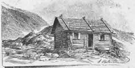
Villacher-Hütte 2250 Meter.

Mit der Erbauung der Villacher-Hütte war der erste Schritt zur weiteren touristischen Erschliessung der Hochalpenspitze-Ankogelgruppe gethan. War ja der Hauptgipfel der östlichen Tauern vorher nur etwa fünfzehnmal erstiegen worden, die