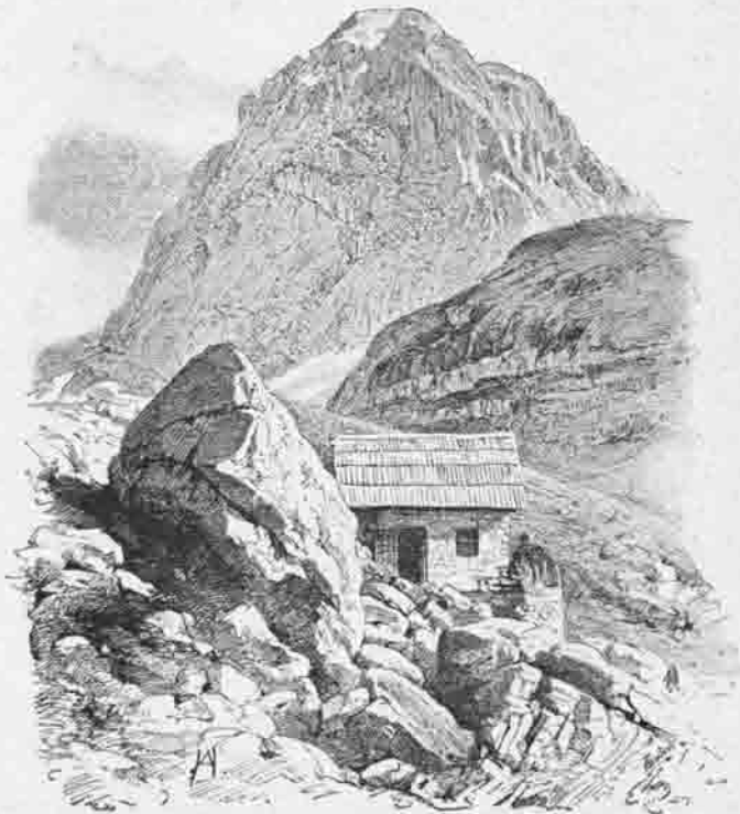
Manhart-Hütte 2000 Meter.

Die Bauten auf der Villacher-Alpe waren vollendet und musste sich die Section um ein anderweitiges Wirkungsgebiet umsehen, wollte sie ihrer Aufgabe als Gebirgssection gerecht werden. Die Wahl fiel, nachdem auf der Kärntner Seite der Glocknergruppe sich schon die Section Prag und später die neugegründete Section Klagenfurt niedergelassen hatten, auf die Julischen Alpen. Man