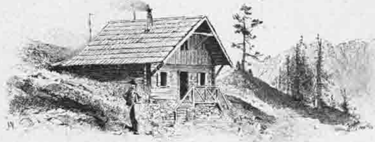
Goldeckhaus 1927 Meter.

In den Jahren 1890—1893 widmete sich die Section ausschliesslich der Verbesserung der bestehenden acht Schutzhäuser und Hütten und der Vervollständigung des ausgebreiteten Wegnetzes.