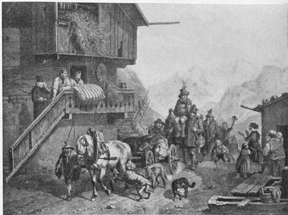
* Aus der Jagdzeitung „Der Deutsche Jäger“, München

Der Mensch nahm ihm seine Heimat, den Urwald, der ihm in Beeren und