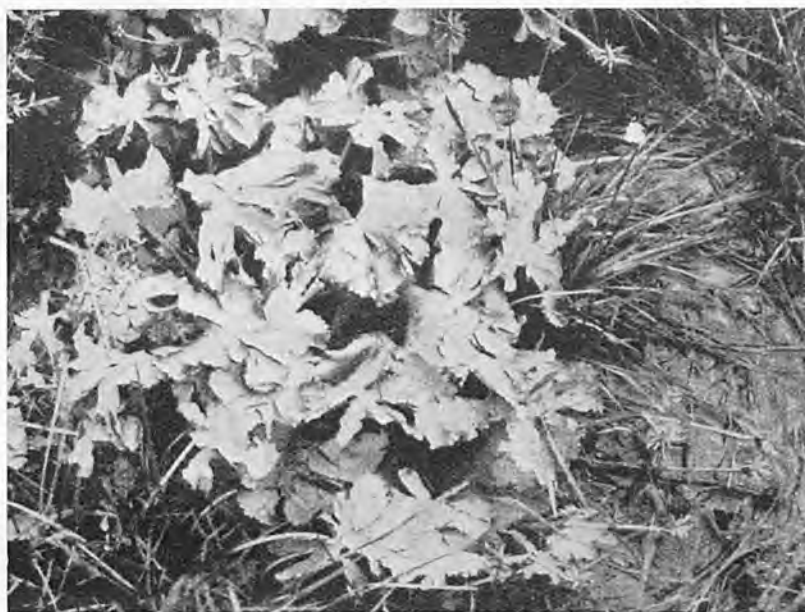
Abb. 2. Wirkung des Hagelschlags bei Caltha

Hagel tritt fast immer in Zusammenhang mit Gewittern auf. Nur dann ist die Bedingung zur Hagelbildung da, wenn stark mit Wasserdampf gesättigte Luft und starker Frost mit raschem Wechsel der elektrischen Ladungen zusammentreffen. Der Hagel ist somit engstens an die Verbreitung der Gewitter gebunden und zieht, wie diese,