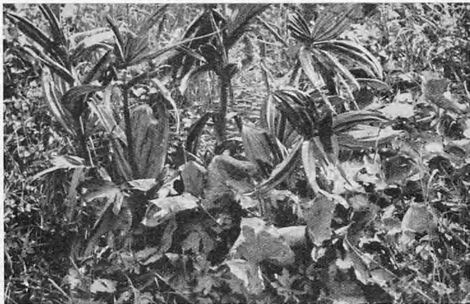
Abb. 1. Wirkung des Hagelschlags bei Beratrum

Hagel ist ein atmosphärischer Niederschlag in Eisform. Die leider sehr verbreitete Verwechslung mit Graupeln kann durch Beachtung folgender Merkmale vermieden werden: Graupeln sind unter 5 mm große zusammengeballte Schneekristalle, die man zwischen den Fingern leicht zerreiben kann. Hagelkörner sind größer als 5 mm, bestehen aus echtem Eis und lassen sich nicht zerreiben. Die Form der Hagelkörner ist sehr verschieden. Verhältnismäßig harmlos sind die Nadel-, Kapsel- und Scheibenformen, weil sie, wenn sie nicht zu groß sind, wegen ihrer starken Oberflächenentwicklung stärker dem Luftwiderstand ausgesetzt sind und daher langsamer fallen. Die häufigste Form, die kugel- und