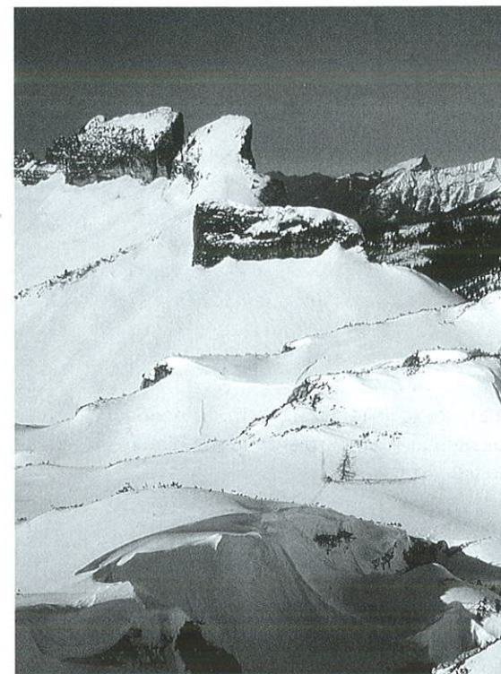
Bräuningnase vom Schwarzmooskogel

Gipfel, nahrhaft: Peischlkopf, Knödelspitz und Wirt sind als „St. Christopher Speisekarte“ ein Begriff, weiters zahllose Grieskögel, Bäurwurz, Kuchenspitze, Brotfall, Schmalzkopf, Schmalzträger, Zuckerhut, Zuckerhütl, Pan di Zuccero, Hebenkas, Chäserugg. – Einem Friesling, der sich damit übernommen hat, sei der Gang zum Speiereck oder zum Brechhorn empfohlen.