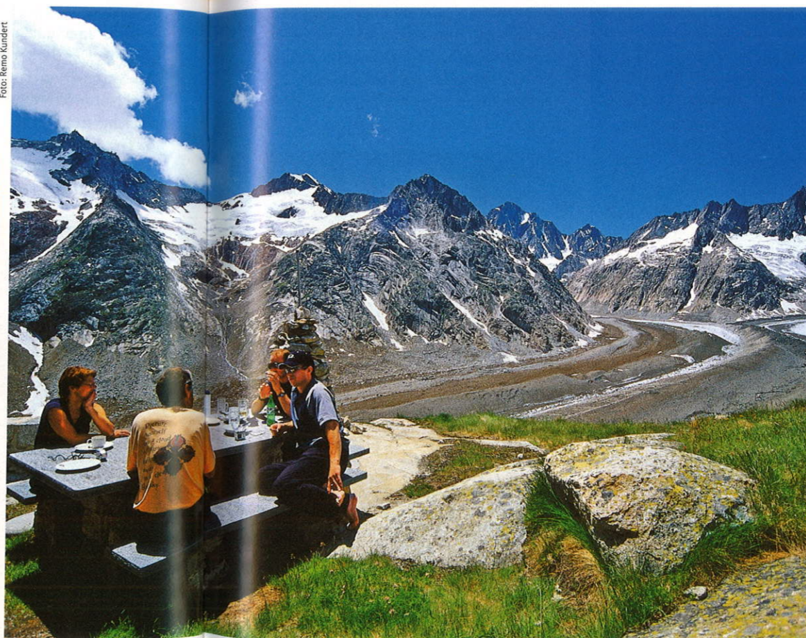
Technik hin, Design her – die alpine Landschaftskulisse ist unübertrefflich. Vor der Lauteraarhütte/BE

Einkammerprinzip und hin zum abgetrennten, meist im Dachstock untergebrachten Strohlager. Einen weiteren grossen Schritt machten die SAC-Hütten dann ein halbes Jahrhundert später. Mit der zunehmenden Mobilität nach dem Zweiten Weltkrieg platzten die Unterkünfte bald aus allen Nähten. Jeder zusätzliche Bergsteiger schmälerte das