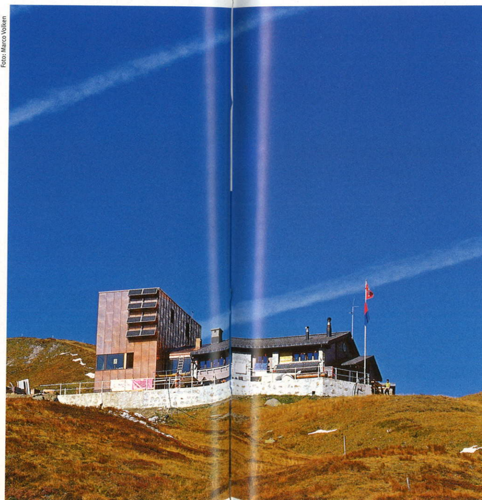
Der Zeitgeist spiegelt sich auch heute im Hüttenbau wider. Capanna Motterascio/TI

sensationellen Lage, dem Naturerlebnis und der Gastfreundschaft in den Hütten lebt: die Übernachtung in der SAC-Hütte als Kontrast zum Leben in den eignen vier Wänden und als Bindeglied zur rauen Bergwelt, in der sie steht. Ganz falsch kann die eingeschlagene Richtung nicht sein, halten sich die Übernachtungszahlen doch in den letzten Jahren konstant über der 300 000er-Marke. Im Jahre 2003 wurde mit 350 000 sogar ein historischer Rekord in der über 140 Jahre langen SAC-Hüttengeschichte erreicht.