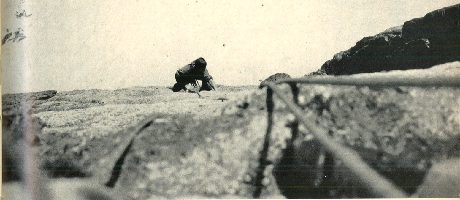
Aber es gibt auch noch Direttissima -Routen, in denen die Freikletterei groß geschrieben wird, Anstiege, die echte Kletterfreude vermitteln, in den Alpen oder z. B. wie hier in der Hohen Tatra (polnische Seite): Zamarla-Turnia-Südwand.

Der Drache ist vergiftet, Siegfried ist arbeitslos geworden. Jeder macht sich jeden Weg möglich.