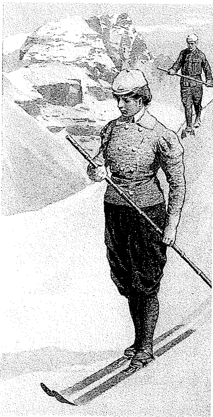
Gegen Ende des 19. Jahrhunderts entwickelt sich eine spezifische Kleidung für die Frauen zum Bergsteigen und Skifahren; Gustav Jahn zeichnete schöne Modelle

te sowie lange und sperrige Röcke, im besten Fall ein Flanellunterrock, waren auch auf den Gletschern der Westalpen die Regel. Hosen hätte man als skandalös empfunden. Eine der Bergsteigerinnen hatte eine Methode ausgeklügelt nach der, am Rocksäum mehrere Ringe genäht wurden, die man bei Bedarf an einem Finger der Hand einführen konnte, um den Rock quasi automatisch aufheben zu können. Dieses System erwies sich jedoch vor allem bei Regen als unnützlich, weil der Rock nass und schwer wurde.