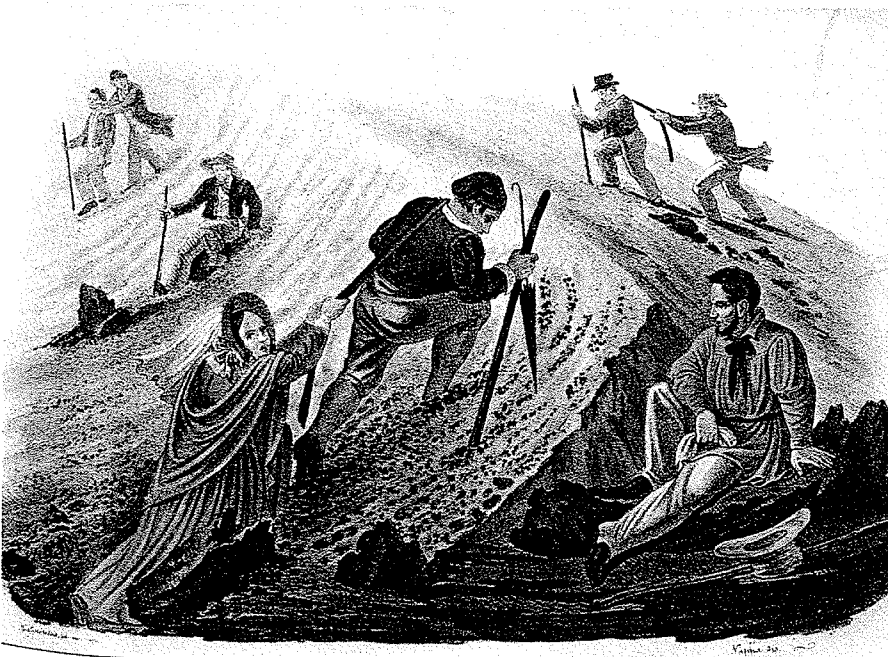
Die Emanzipation der Frau im Alpinismus und Klettersport, zwei traditionelle Männerdomänen, ist parallel zu ihrer Emanzipation in allen anderen Berufs- und Lebensbereichen zu sehen

Die ersten Bergsteigerinnen kletterten und wanderten noch ohne spezifische Bergsteigerbekleidung. Steife Korset-